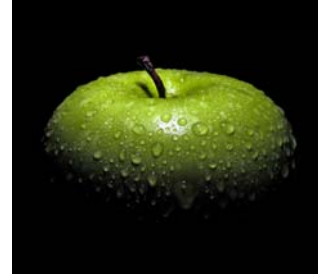
POMA GRANNY SMITH